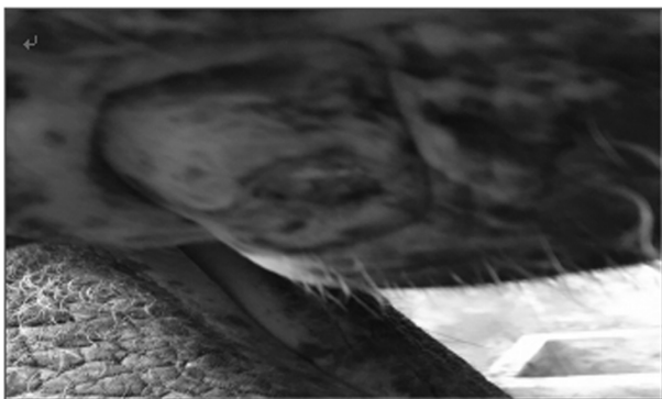
图 3 局部清创处理

1) 大多数哺乳动物只有乳牙和恒牙 2 副牙齿,然而大象换牙不管在次数上还是形式上都与人类不尽相同。由于进食大量粗糙食物,牙齿磨损情况比一般动物严重,作为生理性的补偿,除了暴露在