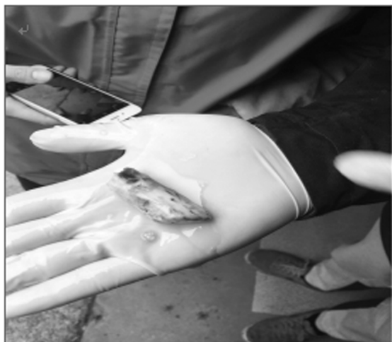
图 1 断牙

每天投喂奥硝唑 0.25 g × 50 粒,每隔 2 d 用酒精棉擦拭患处,擦去脓液,用注射器将双氧水注射